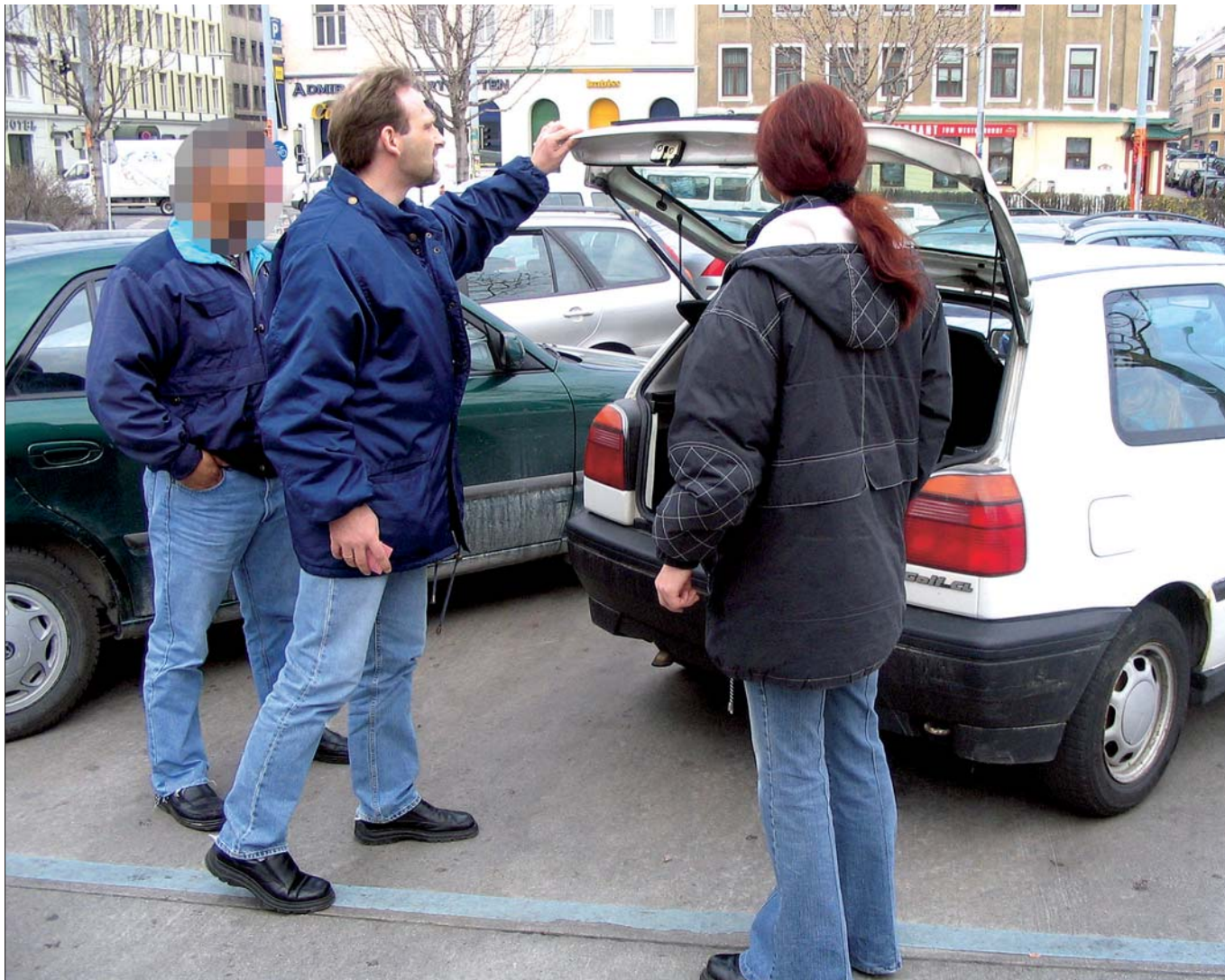
Sonderstreife: Schwerpunktaktion gegen Eigentumskriminalität in Wien.