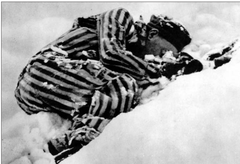
Nach dem Ausbruch aus dem Todesblock im Schnee erfroren.

schlecht ernährt wurden, „dass sie verhungern mussten“.