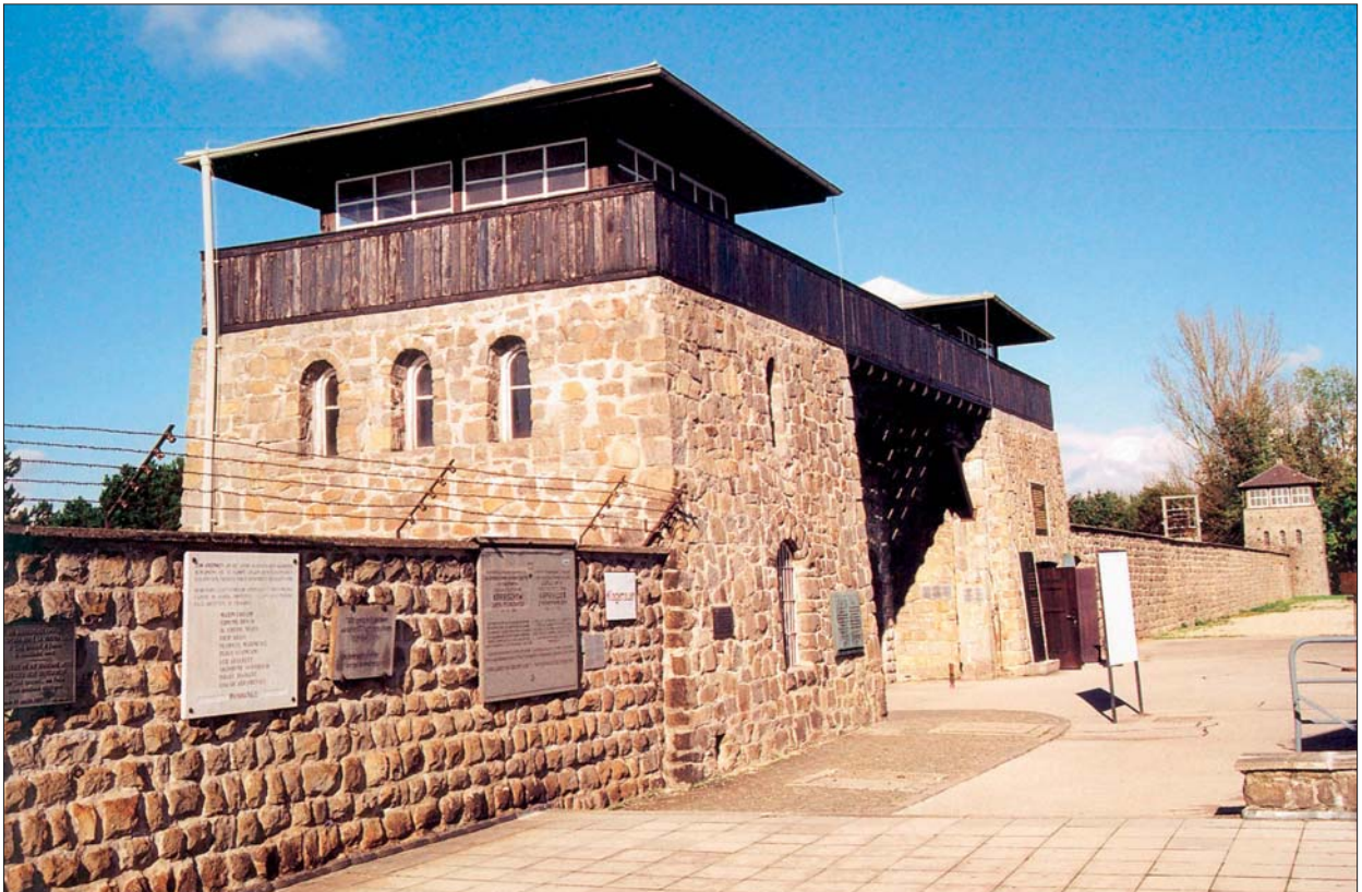
In der Nacht des 2. Februars 1945 brachen 500 Menschen aus dem NS-Konzentrationslager Mauthausen aus.