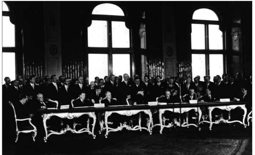
Unterzeichnung des Staatsvertrags im Belvedere in Wien am 15. Mai 1955.

dieses Tages in Warschau den „Warschauer Pakt“, das Verteidigungsbündnis der Ostblockstaaten unterzeichnet –, hatte im Wesentlichen nur noch das Ergebnis der Botschafterkonferenz zu approbieren. Eine für Österreich wesentliche Verbesserung wurde dort aber noch erreicht: Leopold Figl beantragte, für viele überraschend, nochmals die Streichung des erwähnten Abs. 3 der Präambel. Wjatscheslaw M. Molotow – er hatte über Vorschlag von John Foster Dulles den Vorsitz inne – und ihm folgend Dulles, Antoine Pinay und Harold Macmillan, erklärten spontan ihr Einverständnis. Damit war binnen weniger Minuten auch diese letzte Frage zu unserer Zufriedenheit geklärt.